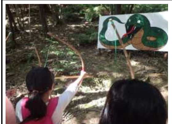
大蛇の国では、弓矢を使って的当てをしました。うまく的に向かって矢を放てるかな。