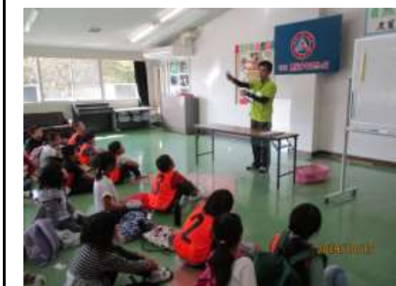
午前中の活動では、わんぱく大冒険に行きました。説明をしっかりと聞いて、頑張ってきて下さい。