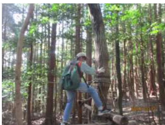
だんだん竹橋では、竹橋を一人一人ゆっくり渡っていました。