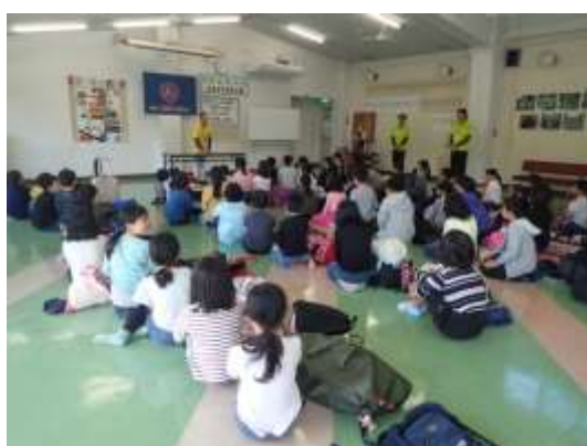
アンケート後、閉校式を行いました。初日とは見違えるほど、話を聞く姿勢ができていました。