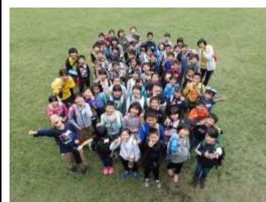
皆さん、お疲れさまでした。集合写真の顔は、とても良い顔をしてました。また、参加してね。