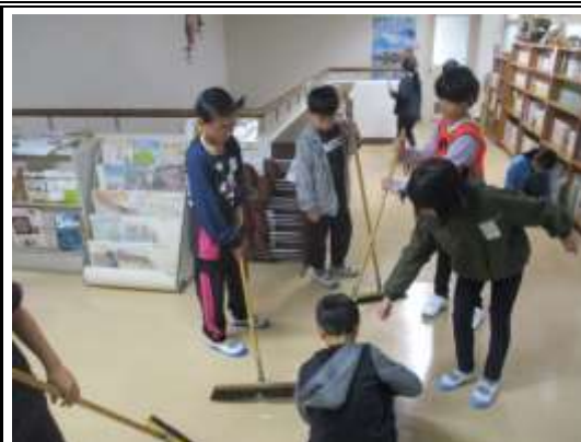
朝食前に、清掃を行いました。短い時間ですが、一生懸命行っていました。