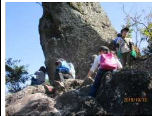
トンガリ岩では、岩の洞回りを班で測りました。班で協力してうまく測れました。