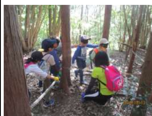
暗黒の世界では、班で協力して暗闇体験をしました。障害物をうまくかわせるかな。