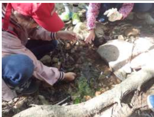
小鳥の泉では、水の温度を予想しました。みんなで水に手をつけて何度なのか話し合っていました。