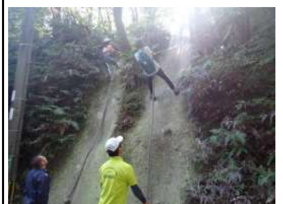
レインジャーでは、怖がりながらもみんな降りました。降りる姿勢は、バッチリでした。