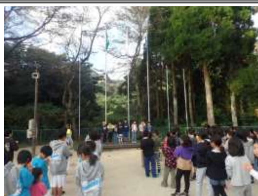
朝のつどいを行いました。皆さん、元気なよい挨拶をしていました。